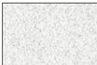
Схема расположения объекта аренды на поэтажном плане с обозначением номера и площади передаваемого в аренду помещения (части помещения):

№ _____ по состоянию на « ___ » _____ г.